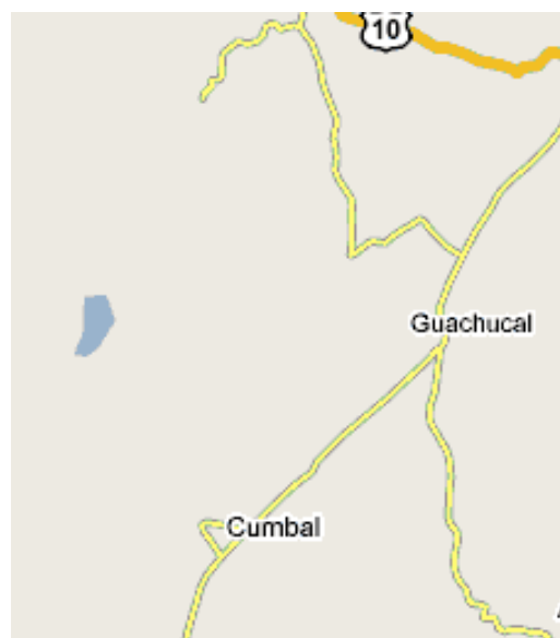
Mapa Departamento de Nariño / Municipio de Cumbal 13